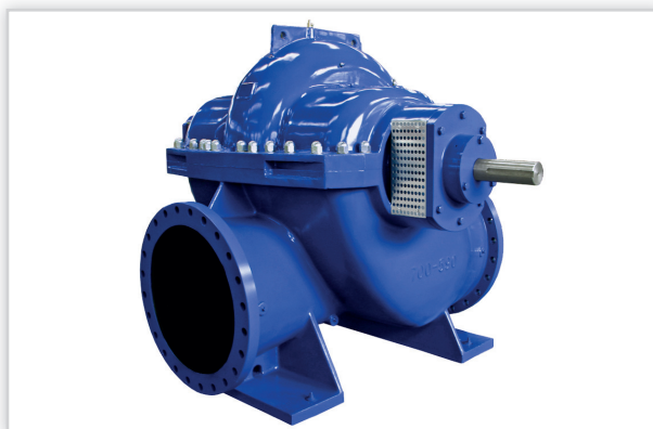
Hydro-Vacuum S.A., Pompy jednostopniowe odśrodkowe typu MV, NHV, dwustrumieniowe typu DHV. Rodzaj czynnika: woda czysta, zanieczyszczona, cieple o niskiej lepkości. Maks. temperatura czynnika [°C]: +110. Maks. wydajność [m³/h]: 12000. Maks. wysokość podnoszenia [m]: 220.