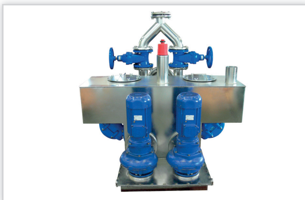
Hydro-Vacuum S.A., Tłocznie ścieków typu TSA, TSB. Budowa: podzespół zbiornika ze stali kwasoodpornej z komorą rozdzielająco-przelewową, separator, urządzenia zabezpieczająco-sterujące, sonda ultradźwiękowa, elementy wyposażenia dodatkowego w zależności od wymagań zamawiającego (przepływomierz, właz, drabinka, bio-filtr, układ dozowania), sterowanie; całość tłoczni zabudowana w suchym zbiorniku podziemnym. Maks. wysokość podnoszenia [m]: 140. Maks. dopływ ścieków [m³/h]: 400. Maks. liczba pomp: 4. Maks. wymiary zbiornika (wys./szer./dł.) [mm]: 2750/2500/2500. Cechy szczególne: rozwiązanie wykorzystujące układ separatorów przed każdą pompą (chronione patentami). Zastosowanie: przepompowywanie ścieków komunalnych w systemach kanalizacji ciśnieniowej.