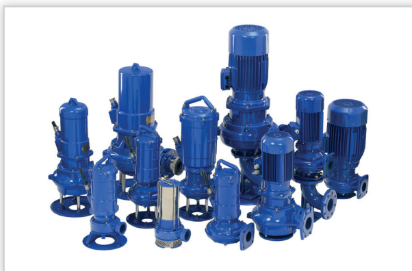
Hydro-Vacuum S.A., Pompy zatapialne typu FZ do cieczy zanieczyszczonych (także pompy z rozdrabniaczem) oraz do zabudowy suchej. Rodzaj czynnika: woda, fekalia, cieple zawierające ciała włókniste, cieple gazujące, ścieki komunalne i przemysłowe. Maks. temperatura czynnika [°C]: +40. Maks. wydajność [m³/h]: 2000. Maks. wysokość podnoszenia [m]: 70. Moc [kW]: 0,55-90. Zasilanie [V]: 230, 400.