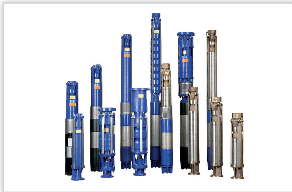
Hydro-Vacuum S.A., Pompy głębinowe typu: GAB, GB, GBA, GBC, GC, GCA, GDB, GDC, GFB. Rodzaj czynnika: woda pitna, uzdatniona, surowa, morska, wody mineralne i termalne. Maks. temperatura czynnika [°C]: +30 (wyższe na zamówienie). Maks. wydajność [m³/h]: 420. Maks. wysokość podnoszenia [m]: 640. Moc [kW]: 0,37-300. Zasilanie [V]: 230, 400, 500, 1000.