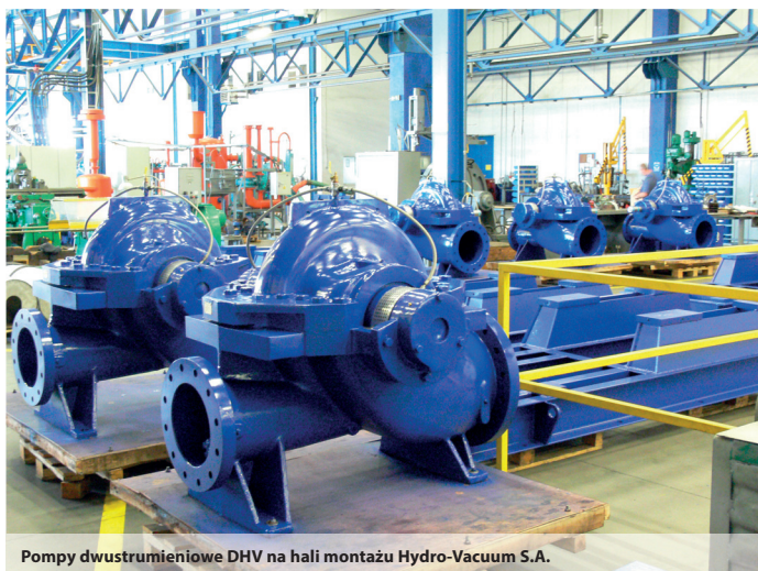
Pompy dwustrumieniowe DHV na hali montażu Hydro-Vacuum S.A.