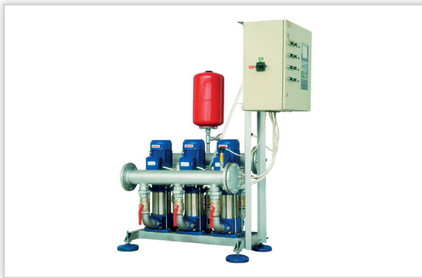
Hydro-Vacuum S.A., Zestawy do podnoszenia ciśnienia typu ZHA, ZHB, ZHE. Kompletnie zestawy pompowe oparte są na pompach odśrodkowych wielostopniowych pionowych typu OPA, OPB, OPE, połączone równolegle za pomocą kolektorów i armatury, wyposażone w układy sterowania i monitorowania pracy. Zastosowanie: praca w przedsiębiorstwach wodno-kanalizacyjnych, spółdzielniach mieszkaniowych, zakładach przemysłowych, obiektach handlowych; dystrybucja również poza granicami Polski.