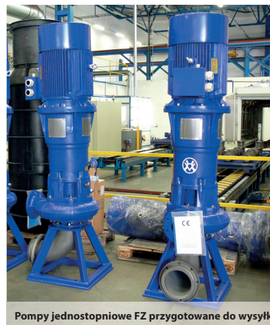
Pompy jednostopniowe FZ przygotowane do wysyłki

Układy zabezpieczająco-sterujące Zdalny monitoring systemów pompowych Odlewnictwo, obróbka metali