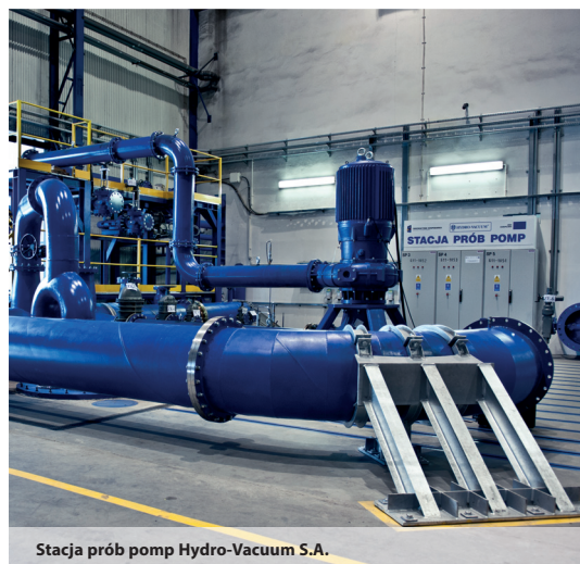
Stacja prób pomp Hydro-Vacuum S.A.